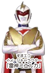
すまエコ イメージキャラクター 「雷神ミエルカ」