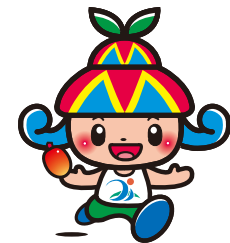
宮古島市 イメージキャラクター 「みーや」