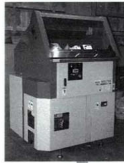
山本製作所製 発泡スチロール減容機 ミニメルター(RE-E200)

宮古島市では、ごみとして回収した発泡スチロールなどを再利用するための中間処理機を川満最終処分場で導入しました。この処理機は、食品用トレーなどを170℃の低温で熱処理し、板状に成形する機械で、ごみのリサイクルと省スペース、輸送コストの削減を目的として導入したものです。