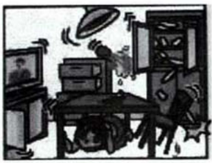
強い揺れが来る前に危険を回避 することができます。

宮古地方気象台 http://www.okinawa-jma.go.jp/miyako/ TEL: 72-3051