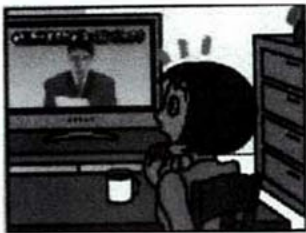
「緊急地震速報」強い揺れがきます！ (揺れの予告が放送されます)