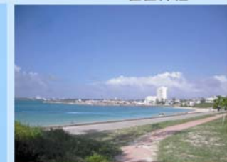
パイナガマビーチ