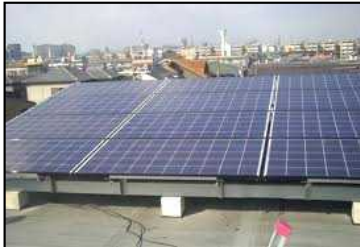
(太陽光モジュールの枚数が確認できる写真)