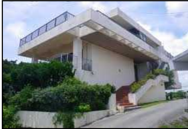
(設置する建物又は土地の全体写真)