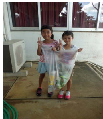
休み明けの運動場のごみ