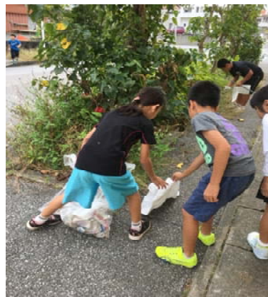
ボランティア活動の様子