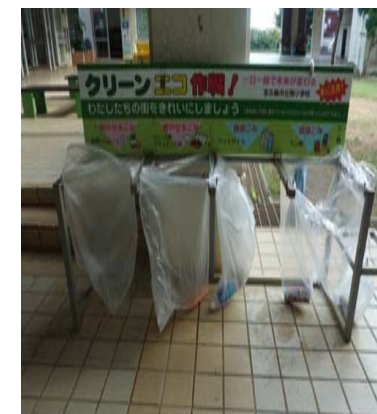
一つ拾ってごみ袋へ