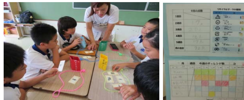
学習後、1カ月間、家庭で取り組み、カードに記録