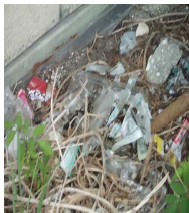
学校のまわりの様子