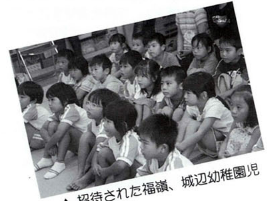
▲招待された福嶺、城辺幼稚園児

宮古島市立城辺図書館では、「読書週間をとおして本や図書館に親しみ、読書への興味を誘発する」ことをねらいとして、学級招待と一日図書館員が開催されました。招待された福嶺、城辺の幼稚園児29名は、おっぱいの会によるフィンガーアクション・絵本の読み聞かせ・エプロンシアター・人形劇に目を輝かせて見聞きしていました。また、一日図書館員には福嶺中学校の生徒4名が挑戦。初めての図書館業務にとまどいつつ、職員の説明を受けながら本の貸し出しや返却業務を行い、立派に一日図書館員をつとめました。