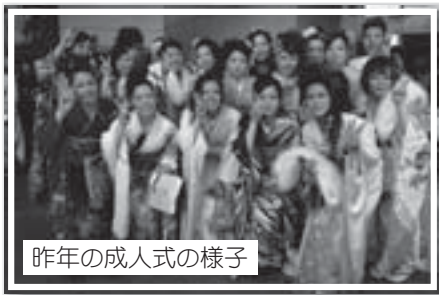
昨年の成人式の様子

てください。 これからの社会を担っていくみなさんには、あらゆる可能性があります。晴れて成人として社会の一員となった喜びを忘れず、自分の思い描く大人になるために更なる成長を遂げていくことを心からお祈りいたします。