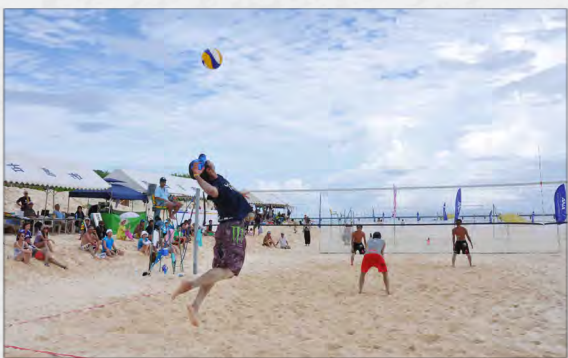
各部門に計96チームがエントリー