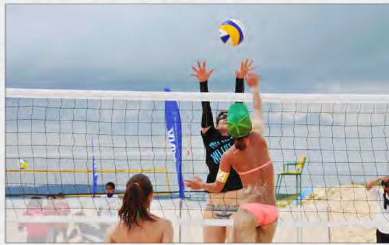
東洋一といわれるビーチで熱戦が繰り広げられた