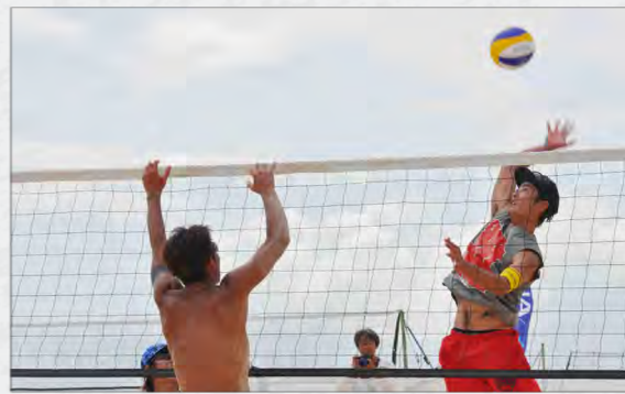
テーマは出会い！感動！飛躍！ビーチの勇者たち