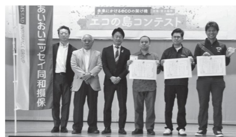
▲エコドライブコンテストでは、上位3チームが表彰された。

2月2日(日)、エコの島コンテストが下地農村環境改善センターで行われ、各団体が行ったエコ活動の成果を市民に向けて発信しました。