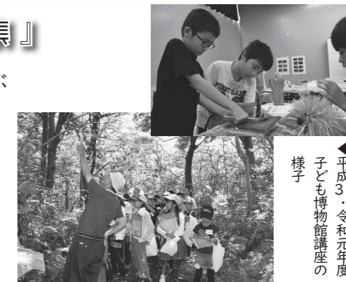
▲平成31・令和元年度 子ども博物館講座の様子