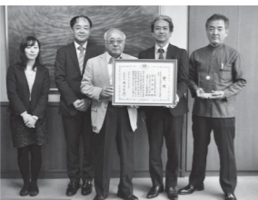
▲2月6日(木)に行われた受賞報告。

今回の受賞は、太陽光発電設備とエコキュートを利用した複合的なエネルギーサービスが高く評価されたもので、今後の活用が期待されます。