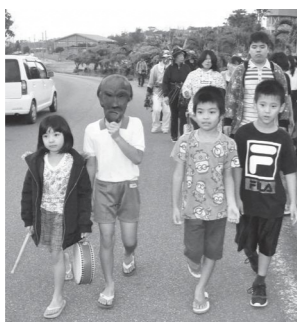
▲仮面を付けて集落を歩く子どもたち

1月28日(火)に上野野原地区で、伝統行事の『サティパロウ』が行われました。ユネスコ無形文化遺産登録後、見学する人の数も増え続け、集落内には長い行列が伸びて賑わっていました。