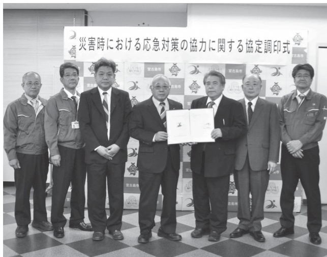
協定に調印した、宮古島市と『一般社団法人 沖縄県建設業協会宮古支部』役員の皆さま