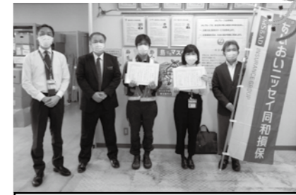
▲2位 JLSAO ランプ様(左) 3位 チームエアライン様(右)