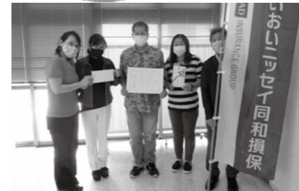
▲1位 チームI・こす様