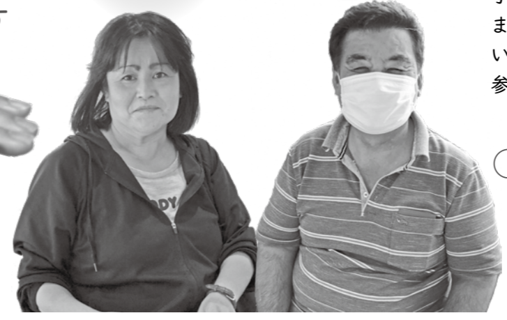
※撮影時のみマスクを外しています。