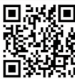
電子図書館 QR コード