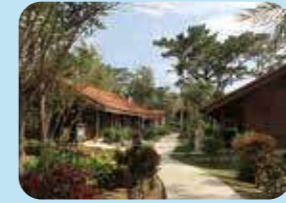
宮古島市熱帯植物園 (体験工芸村)