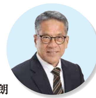
教育長 宮城 克典