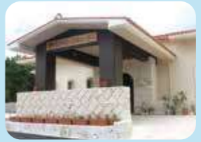
宮古島市伝統工芸センター