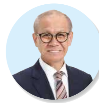
市長 嘉数 登