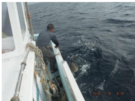
サメ駆除 駆除の様子

漁業被害をもたらしているためサメ駆除を実施し、漁業被害の軽減及び安全操業を図ることとした。また、パヤオ作成・設置について今年度は、前年度作成したパヤオを設置を実施し、カツオ一本釣り漁業等の操業安定化を図ることとした。