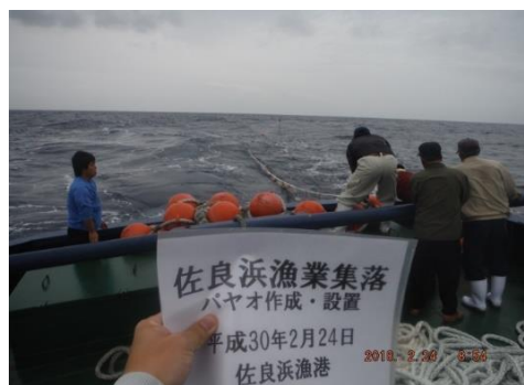
パヤオ設置 本体の投下