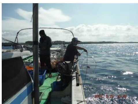
アサヒガニ漁試験 魚の様子

アサヒガニ漁試験を実施し、操業日数の増加を図ることとした。また、一般市民への魚食普及に向けたイベント（お魚まつり）を実施し、水産物の消費拡大を図ることとした。