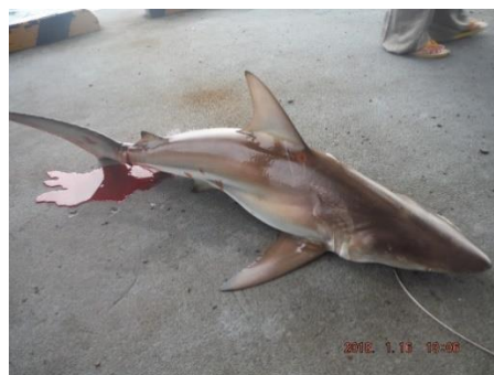
サメ駆除 陸揚げされたサメ