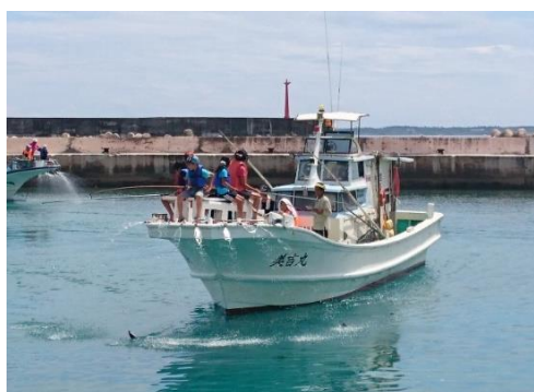
模擬釣り体験の様子