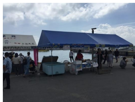
鮮魚販売所の様子