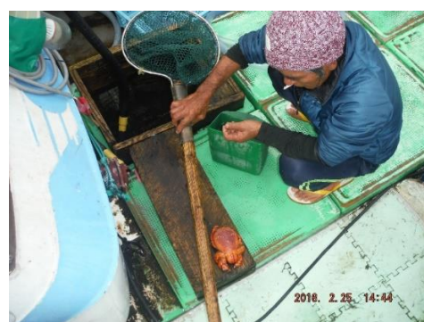
アサヒガニ漁試験 捕獲したアサヒガニ