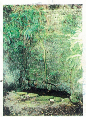
やまとうが 18 大和井