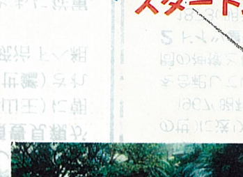
産業界之恩人記念碑