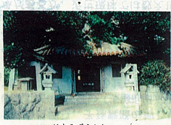
はりみずうたき 8 漲水御嶽