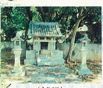
ふなだてどう 21 船立堂