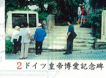
2 ドイツ皇帝博愛記念碑