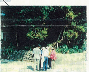
なかやかにもり 23 仲屋金盛ミヤーカー