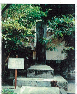
産業界之恩人記念碑