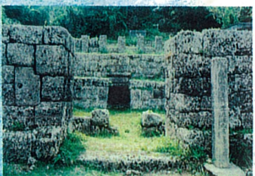
ちりまらとゆみや 11 知利真良豊見親の墓