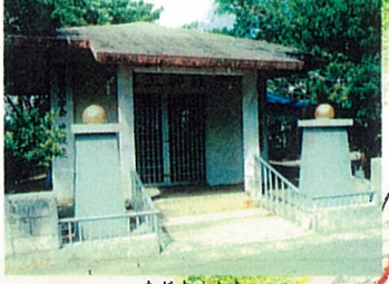
まだまうたき 13 真玉御嶽