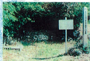
おんがあととぬしべーちん 12 恩河里之子親雲上の墓碑