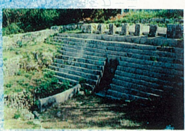
なかそねとゆみや 9 仲宗根豊見親の墓