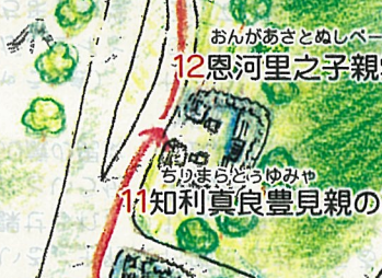
ちりまらとゆみや 11 知利真良豊見親の墓