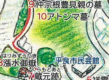
なかそねとゆみや 9 仲宗根豊見親の墓