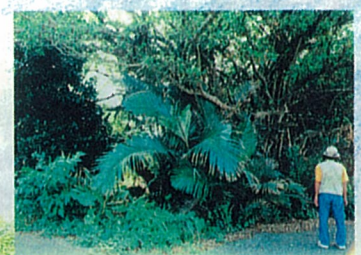
ぼくが 15 湧川マサリヤ御嶽