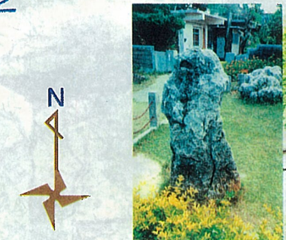
にんとうせいせき 14 人頭税石 (ぶばかり石)