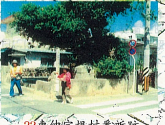
22 東仲宗根村番所跡 ユウラジ御嶽