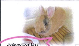
うちのアイドル ハートちゃんです