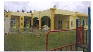
園庭側からの園舎