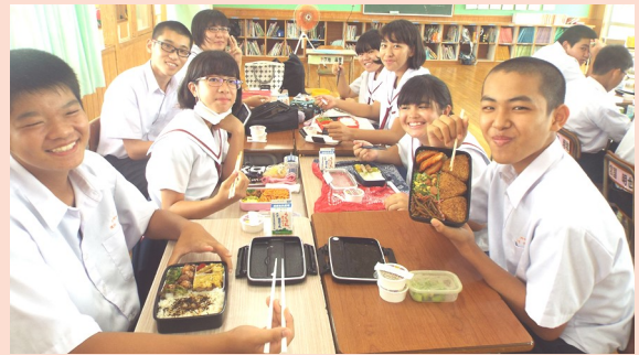
↑「お弁当の日」で笑顔いっぱいの生徒たち↑