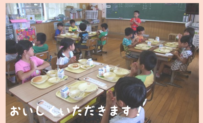
おいしいいただきます!