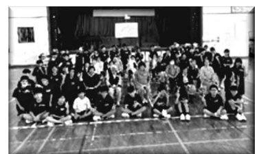
わくわくふれあい運動会