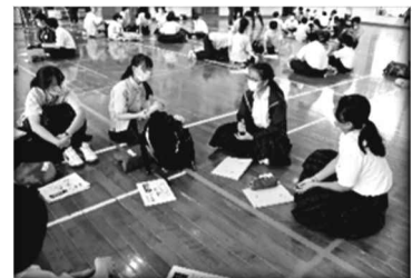
横浜SFS附属中との交流会中

どの活動も自分たちで主体的に準備をし、設定したゴールに向かって計画や話し合いを重ね、実施、振り返りをし、自分たちの活動が周りの人を喜ばせたか、役だったか、また、自分たちを高めたかを振り返りました。これからも、主体的&協働的な行動で新しい城東中の伝統を創っていきたいと思います。