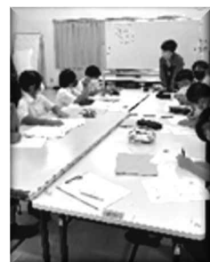
1年わくわくふれあい運動プロジェクト会議