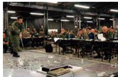
日米共同調整所の設営