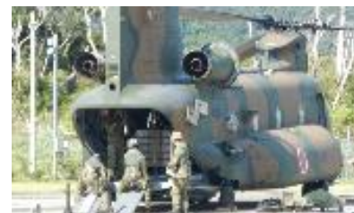
陸自航空機の離発着