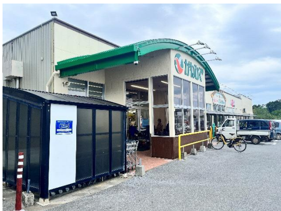
(停留所設置イメージ)