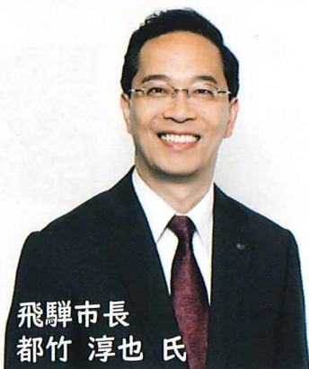
飛驒市長 都竹 淳也 氏

主任講師は飛驒市長! 地域に飛び出す公務員OB (アワード2013 受賞) Facebookで市政情報を 毎日のように発信!